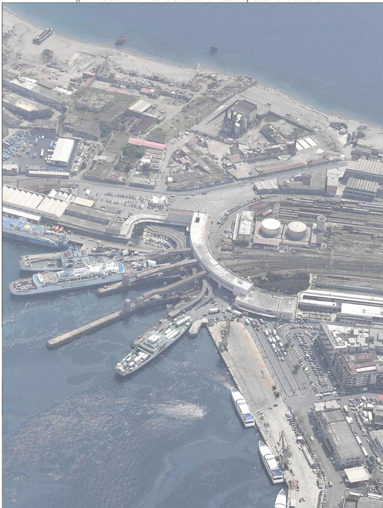
Figura 1. La stazione di Messina Centrale e le invasature protese nel Porto storico