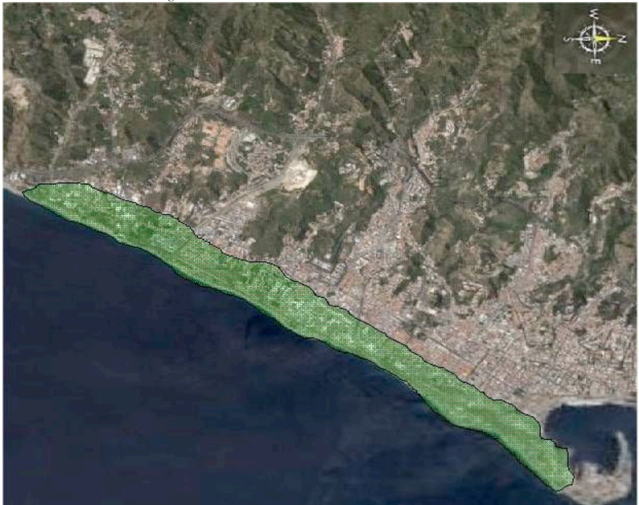
Figura 4. L'area interessata dall'intervento contenuto nel Piau

Negli ultimi anni quest'area è divenuta non solo simbolo di un declino economico e sociale che caratterizza la città ma piuttosto – soprattutto sotto l'egida di riconquistare il mare negato – una delle sfide dell'Amministrazione comunale per la riqualificazione della città e per il suo rilancio, un ambito di intervento privilegiato dal quale, nelle intenzioni delle forze politiche locali, avviare una profonda riorganizzazione della struttura urbana della città, ridefinirne struttura economica, scenari di sviluppo e ruolo territoriale.