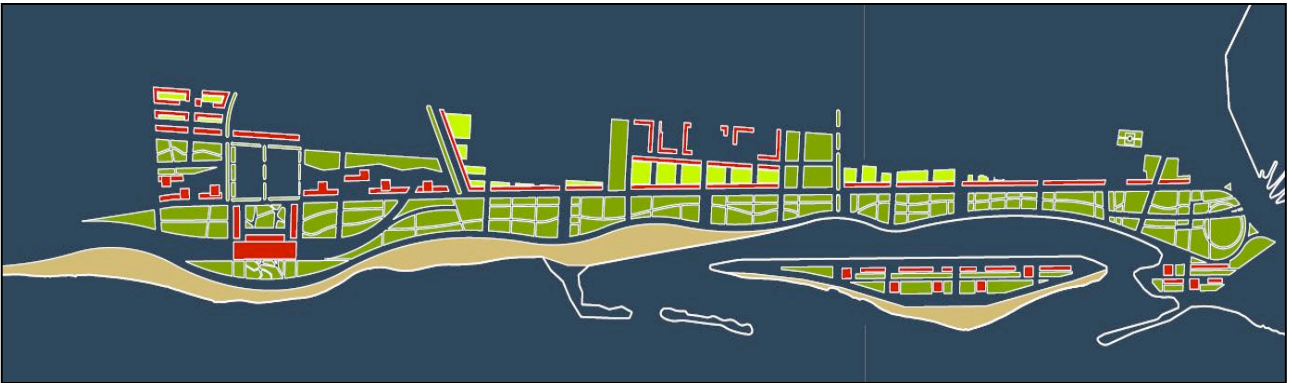
Figura 6. Schema generale del Piau

Alle spalle del canale, in prossimità del Porto storico e delle aree centrali della città, il Parco urbano – che dovrebbe stendersi al posto delle aree ferroviarie per quasi 35 ha – funge da elemento di raccordo tra la città esistente e il waterfront riconquistato, a cavallo del tracciato ferroviario interrato, accogliendo al suo interno e al suo contorno edifici destinati ad ospitare funzioni di eccellenza (per l'arte, la cultura, il turismo, il tempo libero e lo sport) a scala metropolitana. Dal porto verso sud si sviluppa poi la fascia balneare lungo la spiaggia riqualificata, bonificata e resa nuovamente fruibile.