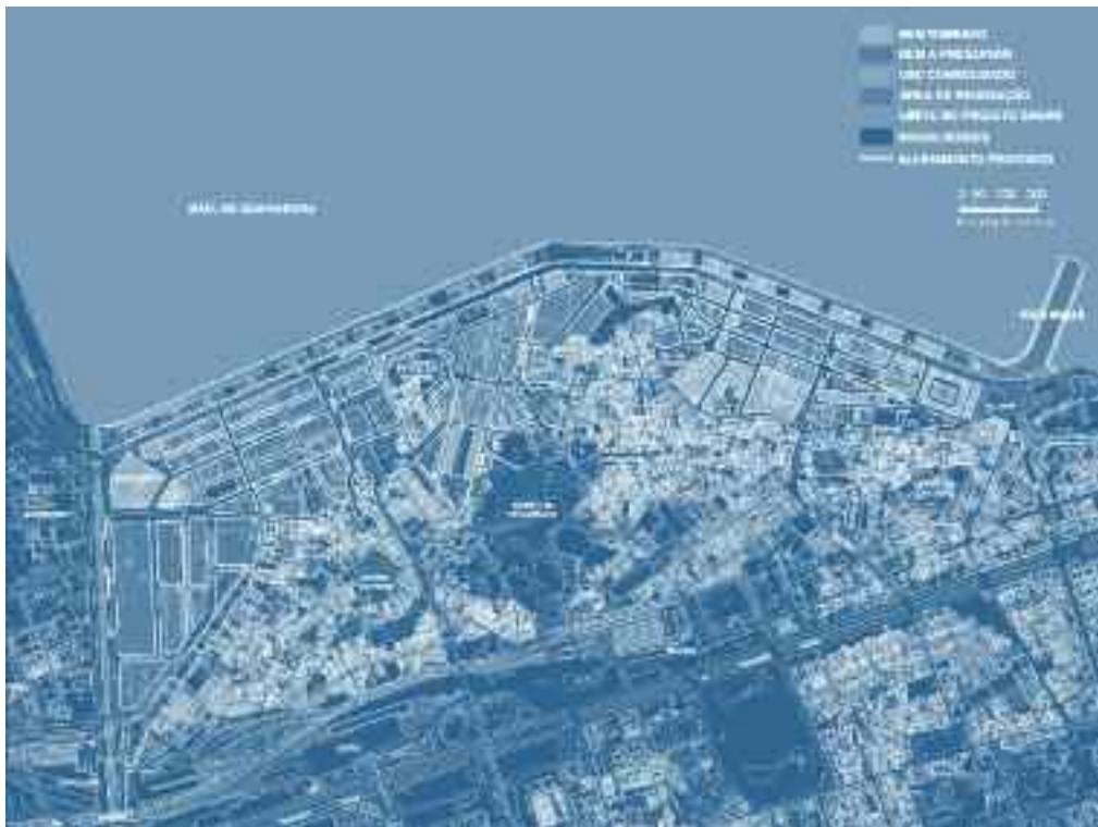
Mapa definición de usos en el Área Portuaria de Río de Janeiro (2008).