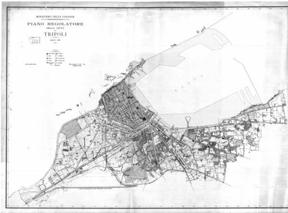
Tripoli, Piano Regolatore della città del 1914. (Istituto Geografico Militare, Firenze).

1. D.E.L. Haynes, An archaeological and historical guide to the pre-Islamic antiquities of Tripolitania , Antiquities Museums and Archives of Tripoli, Tripoli, 1965; E. Rossi, Storia di Tripoli e della Tripolitania dalla conquista araba al 1911 , Istituto per l'Oriente, Rome, 1968; A. Hutt, G. Michell, "The Old City of Tripoli", in Islamic Art and Architecture in Libya , World of Islam Festival and Architectural Association, London, 1976; M. Warfelli, The Old City of Tripoli , in aarp, Art and Archaeology Research Papers , April 1976, pp. 2-18; G. Messina, La Medina di Tripoli , in Quaderni dell'Istituto di Cultura di Tripoli , I, 1979, p. 6-36; F. Cabasi, Profilo storico urbanistico e sociale della Medina o Città vecchia di Tripoli , ivi , p. 37-44; Abdalla Ahmed Abdalla Elmahmudi, The Islamic Cities in Libya. Planning and Architecture , Peter Lang, Frankfurt