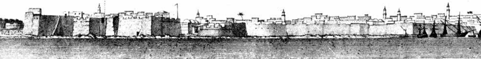
La Tour rouge du Fort par la chute Nord de la Mosquée Sud.

estese anche ai lati adiacenti al mare. Nelle mura si aprivano almeno tre porte, tra cui Bab al-Bahr, la porta a mare, da cui si godeva una splendida vista sul porto “bello e vasto” e sui bastimenti accostati a terra “allineati come corsieri nei loro stalli” 4 . Il 25 Luglio 1510 gli Spagnoli guidati dal conte Pedro Navarro, dopo aver debellato la resistenza degli abitanti, occupano Tripoli. Il quadro politico del Mediterraneo, dopo la caduta di Costantinopoli nel 1453, è del tutto nuovo. La resistenza e la reazione del mondo cristiano, dopo la cacciata e l’espulsione degli Arabi dalla Spagna, si rivolge alla conquista dei porti e delle città del Maghreb, Orano, Bugia, Algeri, Tunisi e quindi Tripoli di cui si cita il “grande et ottimo porto capace di quattrocento nave et vasselli da remo” 5 . Si apre dunque un convulso periodo caratterizzato da continui attacchi e spedizioni di flotte da parte ottomana e dal contrapposto rafforzamento del sistema difensivo del fronte mare e