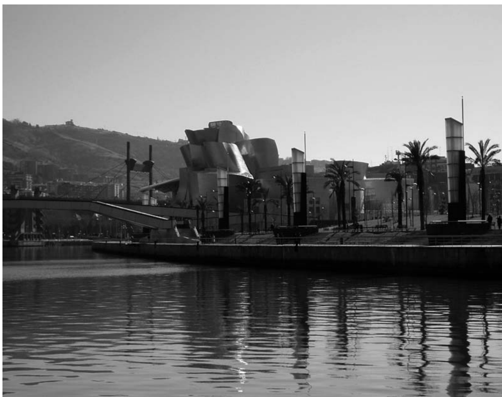
Bilbao, el Museo Guggenheim desde el mar The Guggenheim Museum in Bilbao

establece que, en tanto no se proceda a la aprobación del PUEP, se considerará zona de servicio de los puertos de competencia estatal el conjunto de los espacios de tierra incluidos en la zona de servicio existente a la entrada en vigor de la referida Ley y las superficies de agua comprendidas en las zonas I y II delimitadas para cada puerto a efectos tarifarios. Con esta disposición se salva el vacío que en otro caso hubiera podido surgir en tanto no fueran aprobados los correspondientes PUEP.