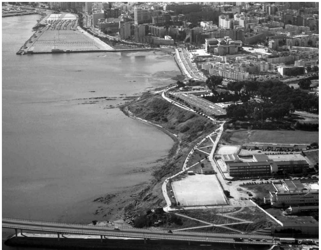
Algeciras, Acceso Norte al Puerto-Ciudad Algeciras, North access to the city-port

régimen local se efectúa rigurosamente sobre este modelo. La fórmula de distribución territorial de los servicios estatales es la del Gobernador actuando a través de sus subordinados los Alcaldes.